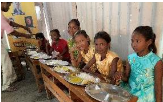
2：家がないストリートチルドレン