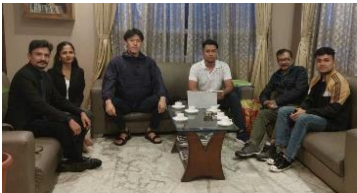
1：貧困層の子供たちに教育支援を行う現地NGO