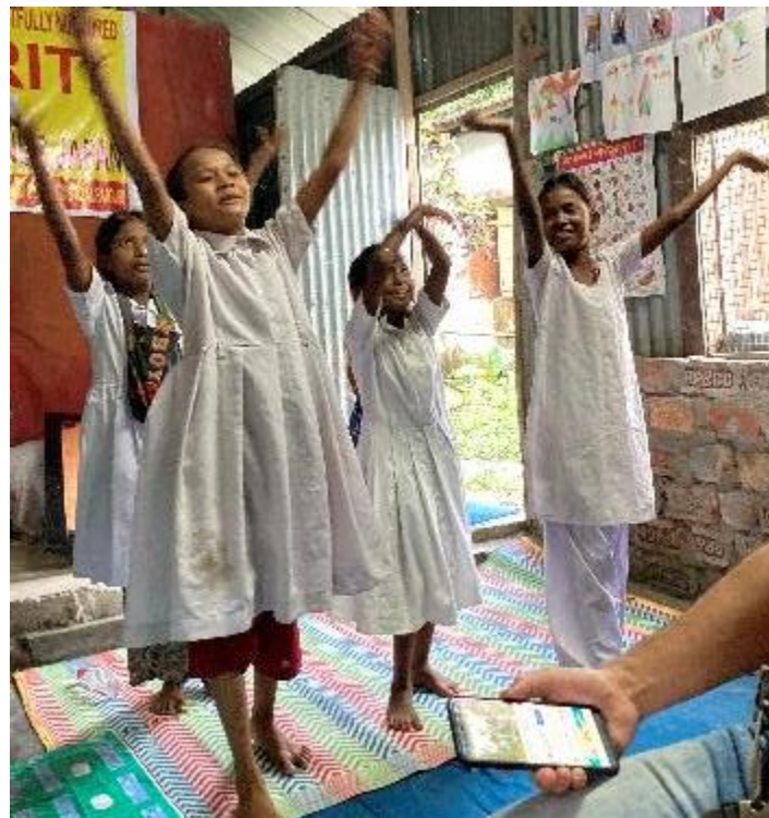
3：保護施設での教育活動