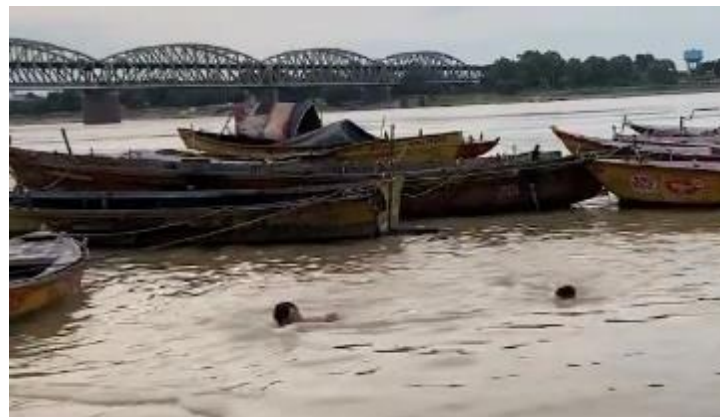
3：ガンジス川でバタフライ