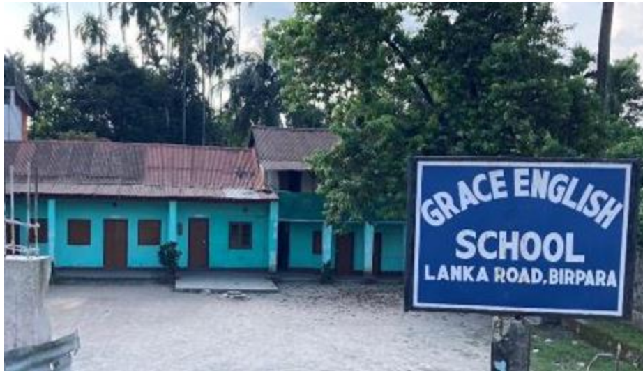
2 : 中間層向けの私立学校への訪問