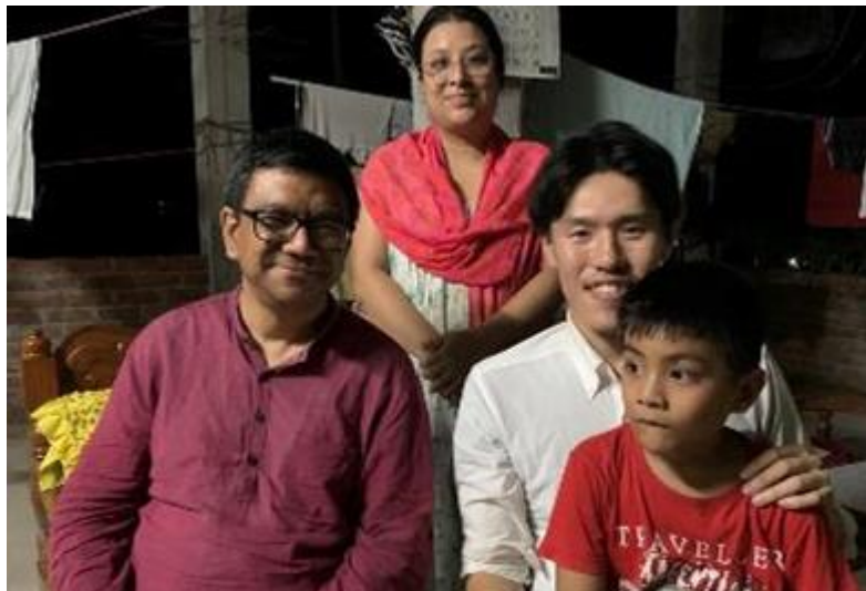
1 : 中間層世帯へのインタビュー調査