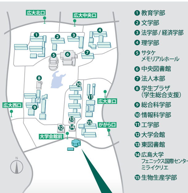
人間社会科学研究科(国際協力学系支援室)